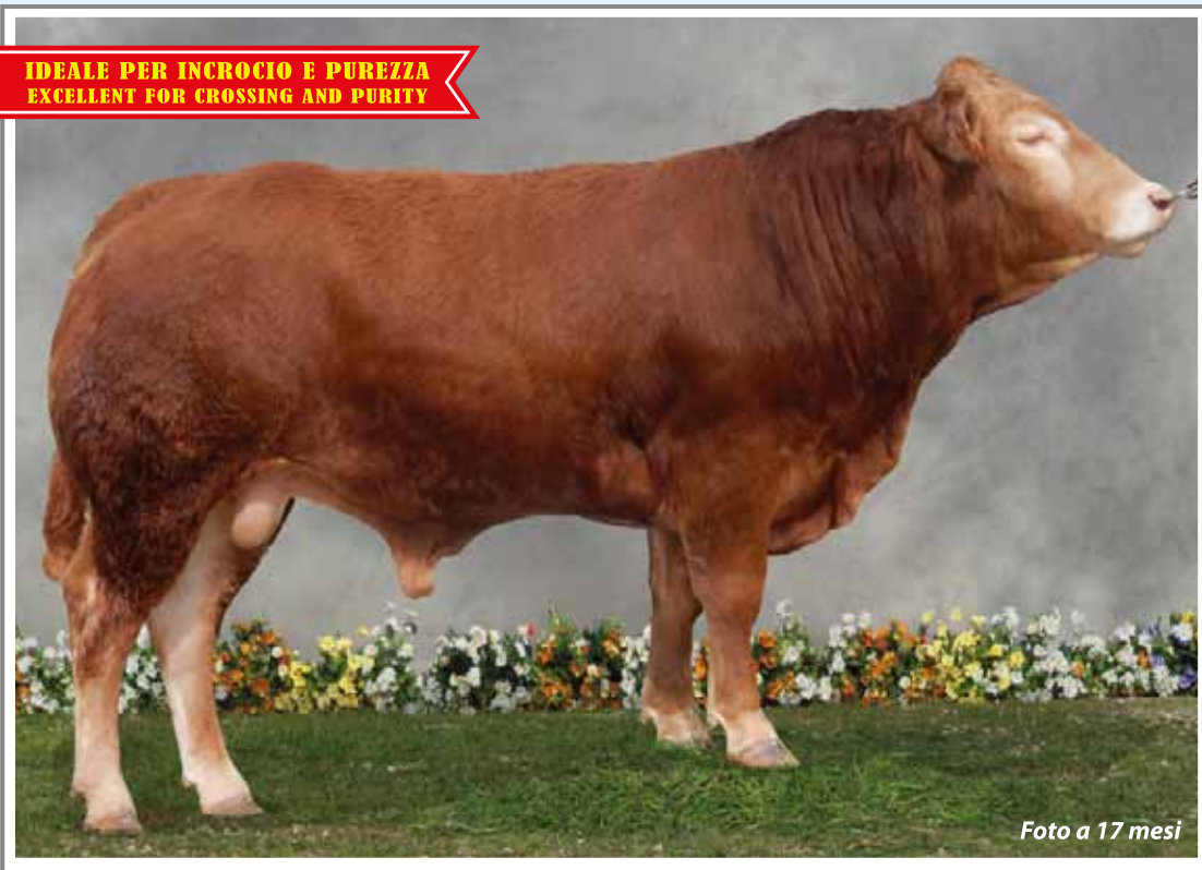
Foto a 17 mesi

IDEALE PER INCROCIO E PUREZZA EXCELLENT FOR CROSSING AND PURITY