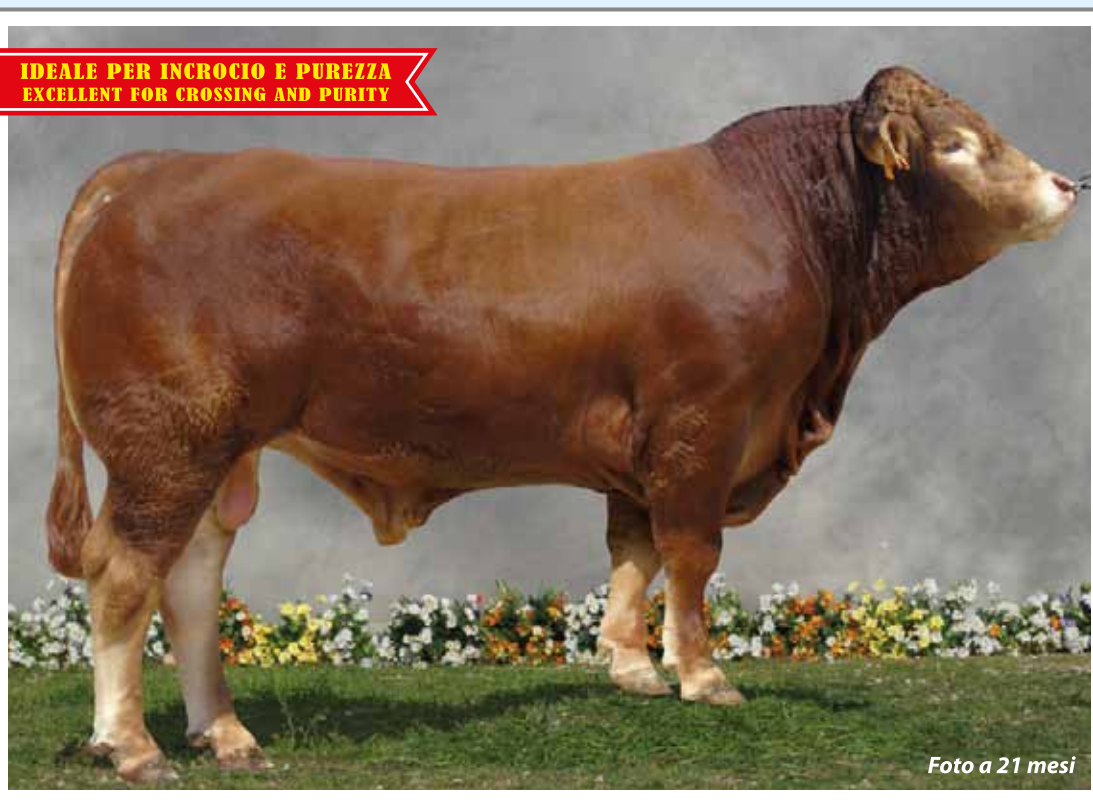
Foto a 21 mesi

IDEALE PER INCROCIO E PUREZZA EXCELLENT FOR CROSSING AND PURITY