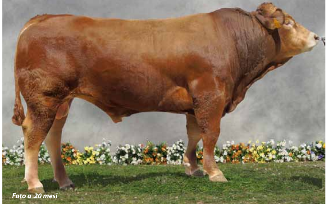
Foto a 20 mesi

IDEALE PER INCROCIO E PUREZZA EXCELLENT FOR CROSSING AND PURITY